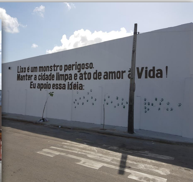
Reciclando Atitudes na Cidade – bairro Rodolfo Teófilo.