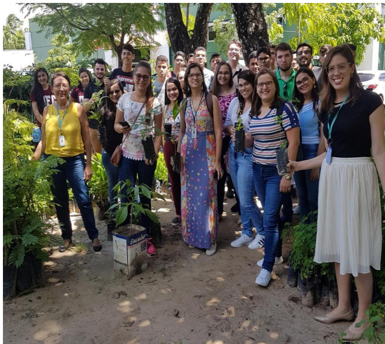
Visita à SEUMA.