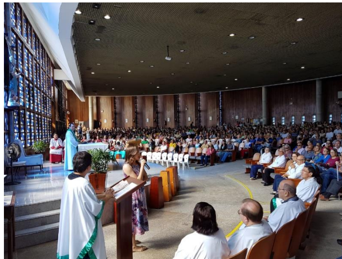
Igreja da Glória.

Articulação, mobilização, reuniões, rodas de conversa, palestras, sensibilizações e ações porta a porta são realizadas em parceria com entidades religiosas com o apoio de seus líderes espirituais. Cristãos, evangélicos, espíritas, praticantes de religiões de matrizes afro são contatados e engajados em campanhas e ações socioambientais da Prefeitura de Fortaleza.