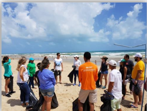
Limpeza na Praia do Lido.