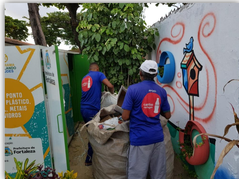
Coleta de recicláveis em uma Escola PEV.