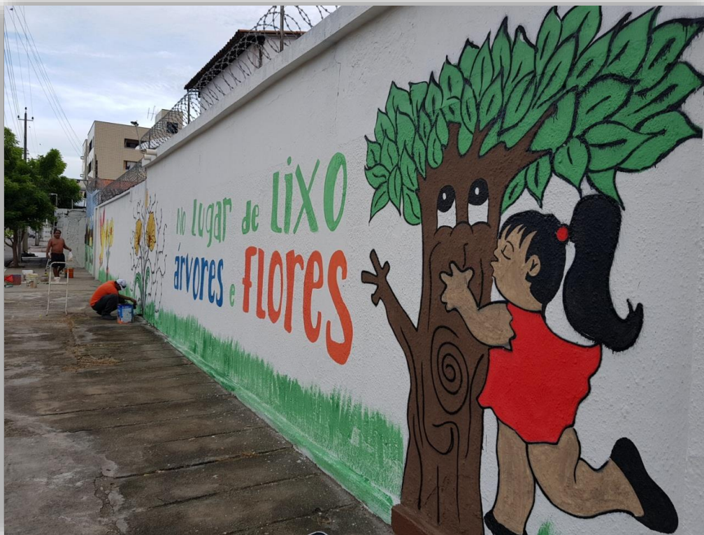
Reciclando Atitudes na Cidade - bairro Cajazeiras.