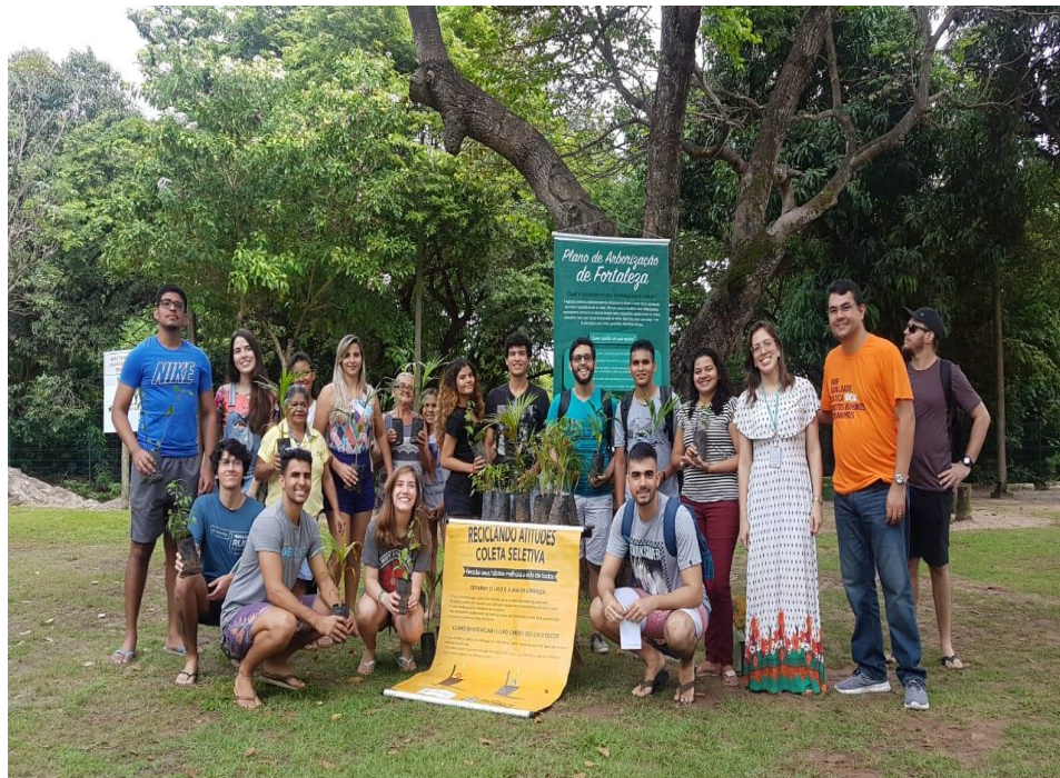
Parque do Cocó.

Principais parceiros: Escolas, Universidades, URBFOR, organizações sociais e sociedade civil.