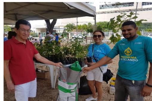
Troca de mudas por recicláveis.