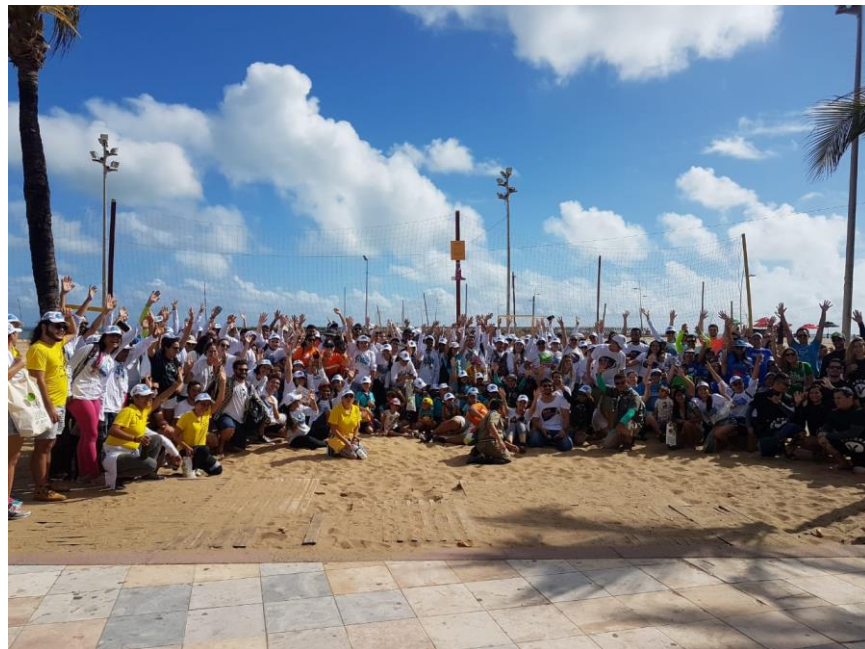
Limpeza na Praia de Iracema.