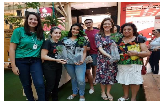
Vivência em um Shopping de Fortaleza.