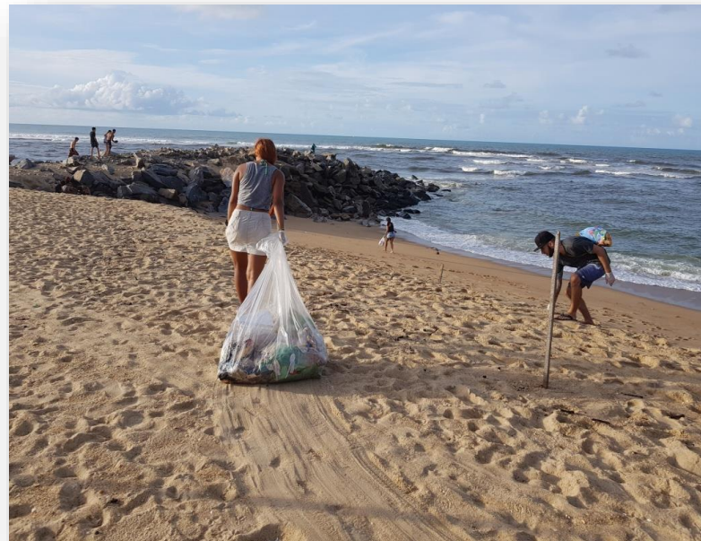
Marco Zero – Barra do Ceará.

O Reciclando Atitudes nas Praias, Rios e Lagoas consiste na articulação, mobilização, roda de conversa, abordagem lúdica, informativa e participativa, troca de mudas por recicláveis, blitzes educativas e catação de resíduos nas praias e entorno de rios e lagoas da cidade.