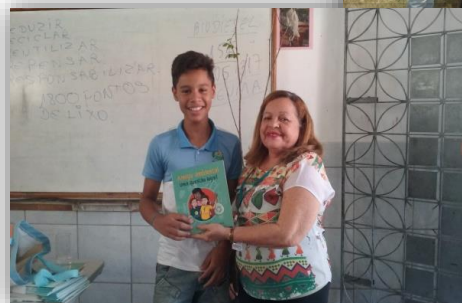
Palestras e rodas de conversa temáticas em escolas.