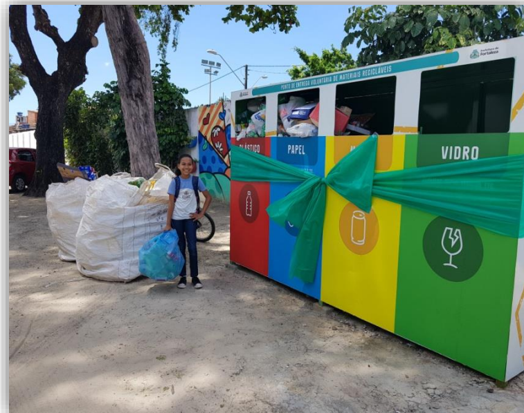
Coletor PEV para recicláveis na escola Antônio Sales.