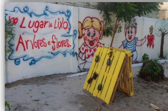
Espaço Reciclando Atitudes em uma escola da rede pública de Fortaleza.